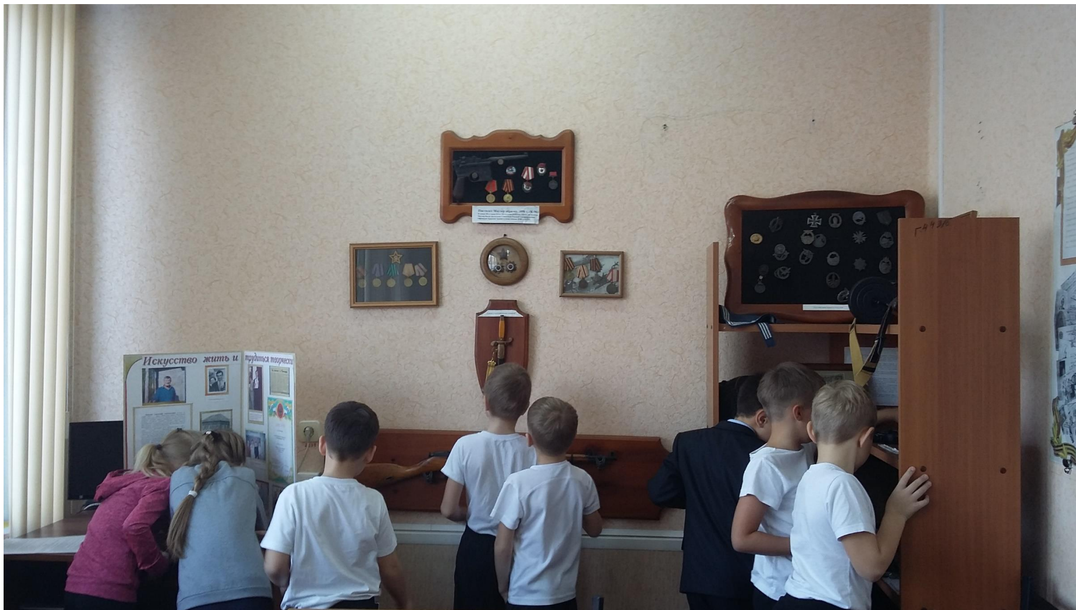
Занятие в музее проводят Активисты музея